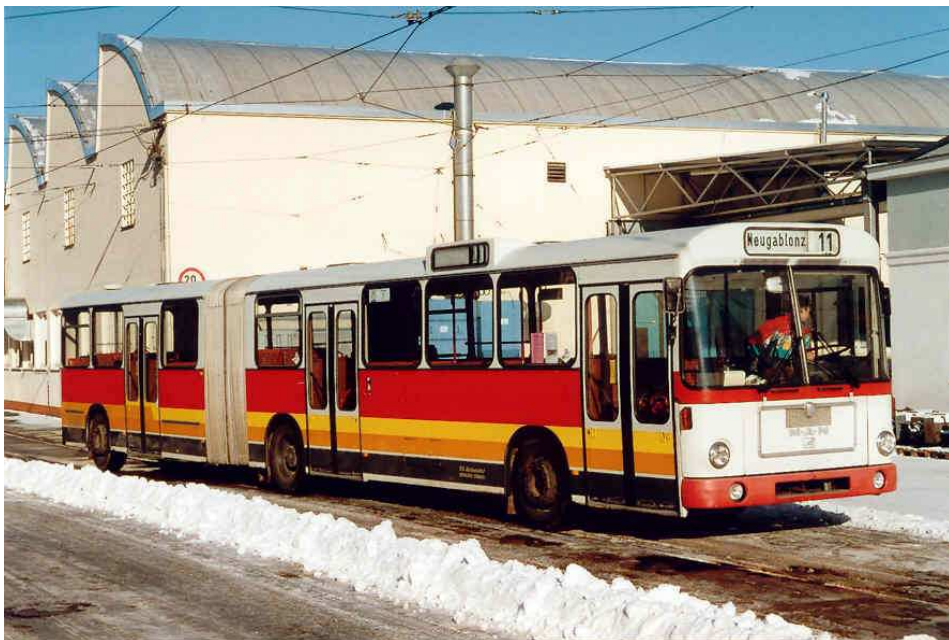
Promotionbus: der 2. Prototyp des MAN SG 240 H soll einmal als Werbebus und für Filmaufnahmen dienen. Das Bild zeigt ihn in der HW Ständlerstraße.