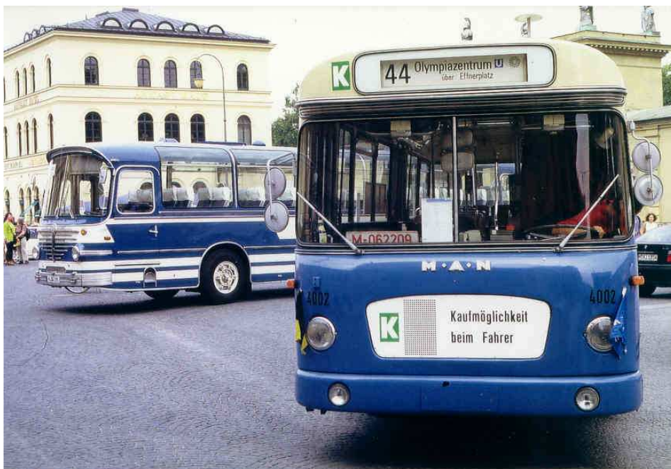
Pflichtübung: zur „Langen Nacht der Münchner Museen“ ist der OCM am Odeonsplatz mit Infostand sowie Museumsbus 4002 (MAN 750 HO M 11 A) der SWM/MVG vertreten. Im Hintergrund ist unser Büssing Präfekt zu sehen, der kurz danach auf Linie 102 (Odeonsplatz – Schloss Nymphenburg – MTU-Triebwerksmuseum) eingesetzt wurde.