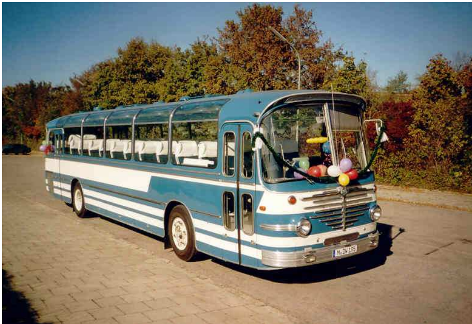
Hochzeitsfahrt: einige Male rückte unser Büssing Präfekt 15 heuer bereits „gewerblich“ aus – hier zur Hochzeitsfahrt für die Tochter eines SWM/MVG-Mitarbeiters.